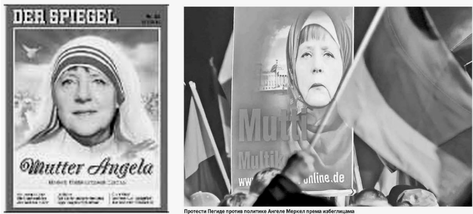
Фотографије 3 и 4: Политика , 22. септембар 2015. и Политика , 4. новембар 2015. године

На Графику 1 јасно се види како у 2016. години слаби интересовање за садржаје везане за мигрантску кризу, избеглице, мигранте и азиланте на насловним странама дневних новина у Србији, па је тако издвојено и мање страна везаних и за религијски елемент. Анализа показује и да је у издвојеним насловним странама Ангела Меркел редован актер, главни или споредни. Фотографија која симболизује њен однос ка мигрантима објављена је још у Политици 22. септембра 2015, уз насловни блок „Како је Ангела Меркел прешла пут од Хитлера до Мајке Терезе“. Контраст су примери фотографија на којима се приказује како је виде противници њене имиграционе политике.