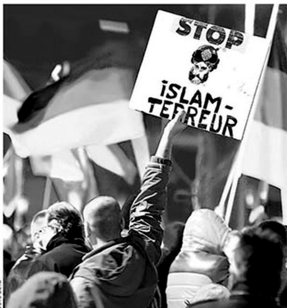
Фотографија 1: Политика , 7. септембар 2015. године