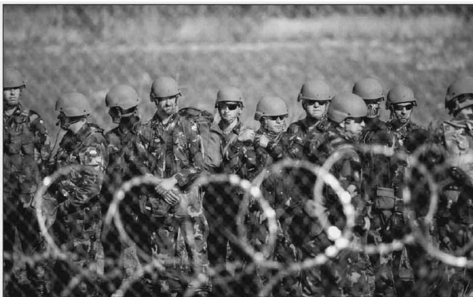
ФОТОГРАФИЈА 5: Данас , 15. септембар 2015. године

У овом истраживању уочавамо како озбиљна штампа даје тон у обраћању пажње на утицај религијског фактора у миграцијама. На тај начин је Виктор Орбан посебно истакнут као „крсташ“, у периоду кризе крајем лета 2015. године. У Данасу су се могли прочитати наслови „Хришћанин Виктор Орбан опет 'брани Европу'“ (4. септембар) и „Орбан испратио 'крсташе' на границу“ (15. септембар), а други наслов прати и фотографија на којој је у првом плану жица на граници и иза оgrade војници спремни за акцију. Тако, иако миграната нема на фотографији, асоцијација је јасна: Европљани су спремни за сукоб између „нас“ и „њих“. Такође, Политика 4. септембра 2015. у поднаслову указује на „призоре у Мађарској као из Другог светског рата“ и констатује како „Виктор Орбан хришћанске вредности и ЕУ брани жицом“.